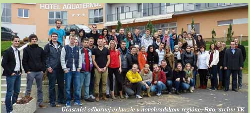
Účastníci odbornej exkurzie v novohradskom regióne.

prípadne časť pedagogického zboru. Vtedy je lepšie ostať doma v pokoji na lôžku, vypotiť sa a začínajúce ochorenie vyliečiť aj podaním vhodného záparu z liečivých rastlín, u nás známeho pod názvom bylinkový alebo bylinný čaj. Pripomínam, že termín čaj je správny iba v prípade záparu, odvaru, prípadne iným spôsobom pripraveného nápoja z listov čajovníka čínskeho. Populárnymi liečivými rastlinami, po ktorých v zimnom období konzumenti siahajú, sú dúška tymianová, dúška materina, mäta pieporná, ktoré pomáhajú prostredníctvom účinného uvoľňovania silíc zlepšiť dýchanie. Pri kašli sprevádzanom produkciou hlienu je vhodné pridať do záparu divozel veľkokvetý a skorocel kopijovitý. Obidve rastliny sú veľmi účinné expektoranciá, podporujú odkašliavanie a sú vhodné pre dospelých aj deti. Na zlepšenie sa pridávajú korigenciá chuti a vône, napr. fenikel obyčajný, bedrovník anízový a pod.