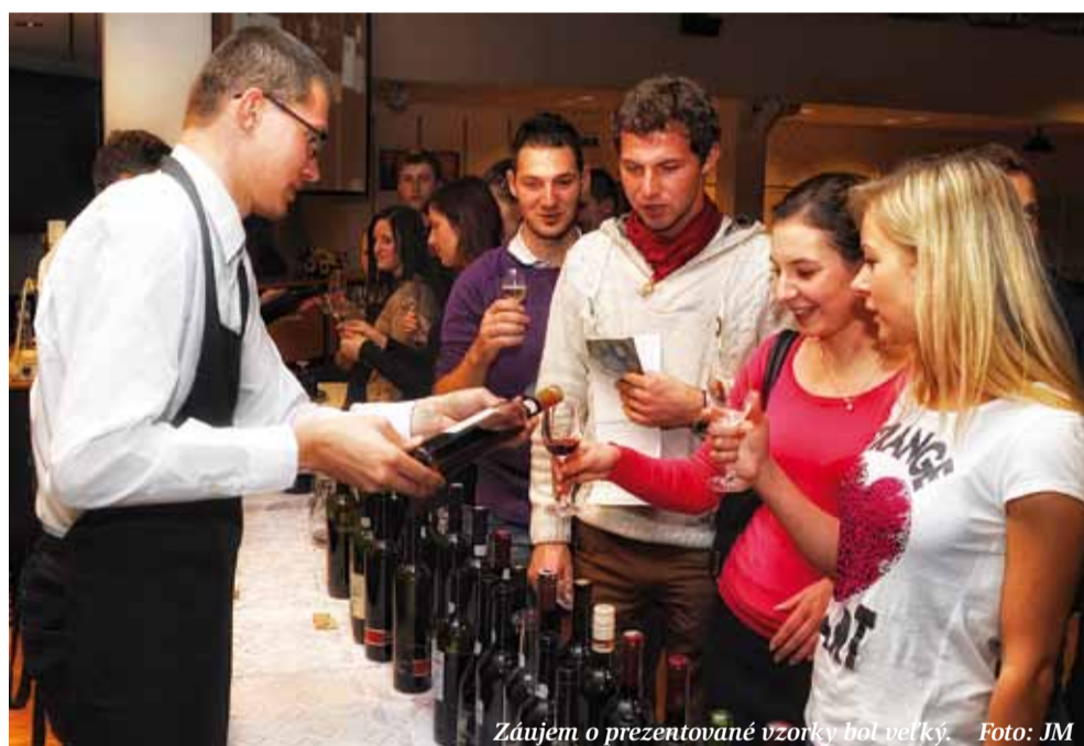
Zaujím o prezentované vzorky bol veľký.

Katedra ovocinárstva, vinohradníctva a vinárstva FZKI SPU organizovala 9. - 11. decembra 2013 celoslovenskú súťažnú prehliadku vín - Víno SPU 2013.