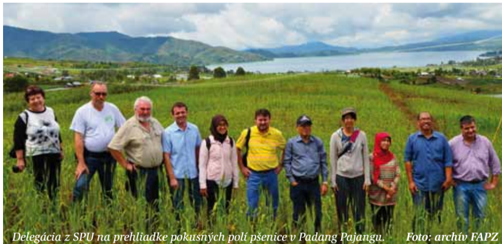
Delegácia z SPU na prehliadke pokusných polí pšenice v Padang Pajangu.