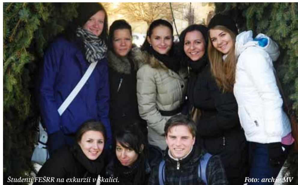
Študenti FEŠRR na exkurzii v Skalici.

Skalica je aj mestom kultúry, kde sa už tradične konajú rôzne festivaly: Skalické dni - festival tradície, hudby a zábavy či Trdlofest - deň trdelníka a vína. Vďaka schopným a ochotným ľuďom má mesto medzinárodný charakter a rozvíja sa vďaka rôznym projektom v cestovnom ruchu. Napr.