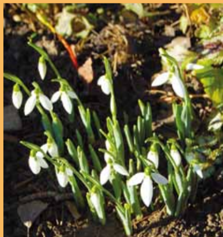
Január v záhradke.

Podarilo sa vám zachytiť nejakú veselú či kurióznu situáciu? Podelte sa o svoje fotoúlovy s čitateľmi Poľnohospodára a pošlite ich spolu s vtipným textom na našu mailovú adresu: redakcia@polnohospodar.sk. Autorov najlepších snímok odmeníme.