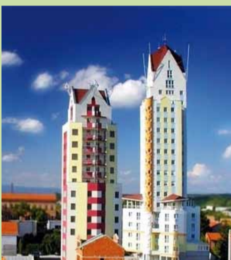
Lučenec, centrum regiónu.